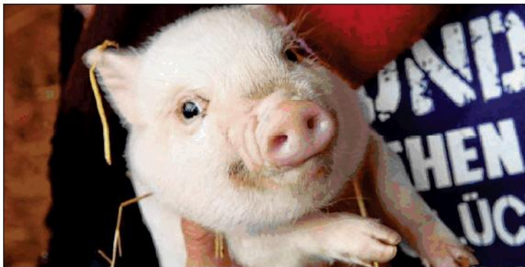
Schwein gehabt: Der Tierschutzverein Offenburg-Zell hat bei der Aktion »Scheine für Vereine« von HITRADIO OHR und den Volksbanken der Ortenau den Hauptpreis gewonnen.

2000 Euro für den zweiten Platz gewinnt der Ortsverein Linx-Holzhausen des DRK Kreisverband Kehl. »Wahnsinn! Wir hatten gar keine Ahnung, wie viel Unterstützung wir aus den Kreis- und Landesverbänden des Deutschen Ro-